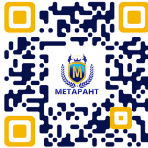
QR code สมัครสอบ

หรือสมัครด้วยตนเองได้ที่ห้องธุรการ โรงเรียนเมธาพัฒน์ ที่อยู่ : 2222 หมู่ 8 ต.หนองบัวศาลา อ.เมืองนครราชสีมา จ.นครราชสีมา 30000 ทุกวันจันทร์-ศุกร์ เวลาทำการ 08.00-16.00น. (ยกเว้นวันหยุดนักขัตฤกษ์)